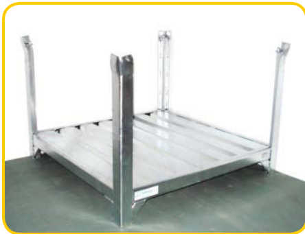
Paleta „Hezon” otwarta