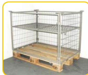
nadstawka z półką: otwarty przód