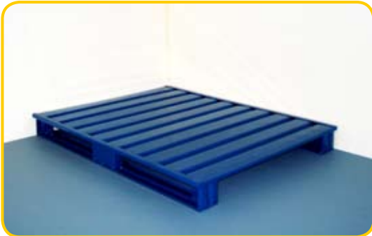
Paleta metalowa, płaska