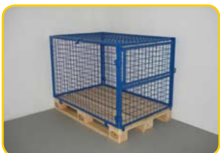
nadstawka zamykana na górze