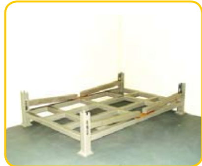
Paleta kłonicowa, składana